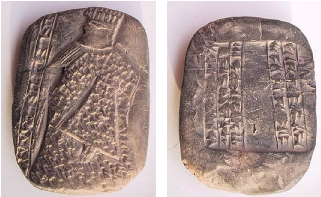
Keilschriften, ähnlich der 1. sumerische Schrift.